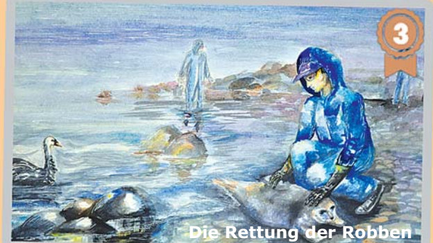
Die Rettung der Robben