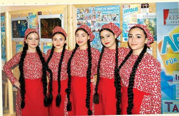
“APPLAUS für die Integration“