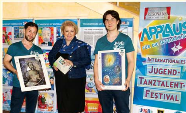
2. Internationales Jugend-Tanztalent-Festival