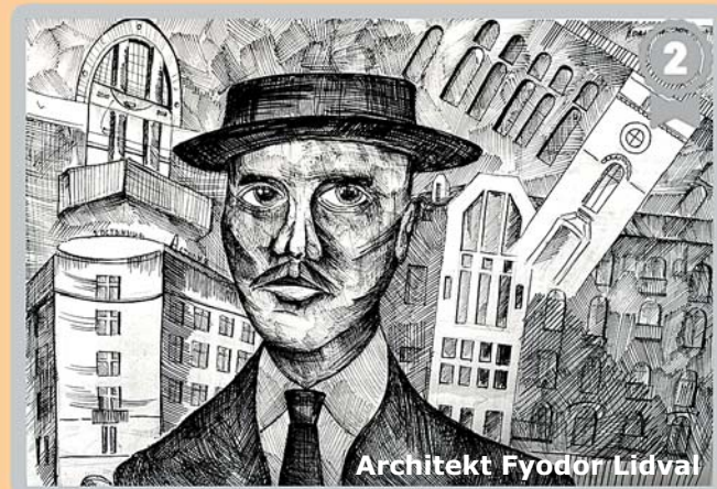
Architekt Fyodor Lidval