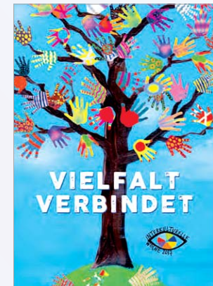
Das Motiv "Baum der Vielfalt" als Postkarte zur Interkulturellen Woche 2017 - Gestaltung: May Aurin, Hamburg