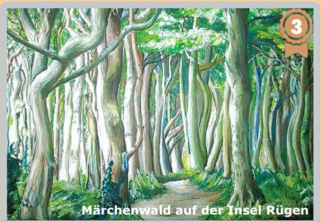
Märchenwald auf der Insel Rügen