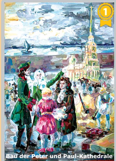
Bau der Peter und Paul-Kathedrale