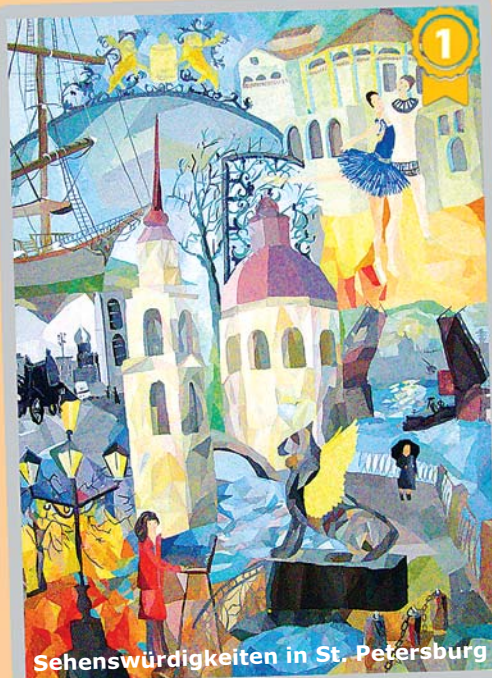
Sehenswürdigkeiten in St. Petersburg